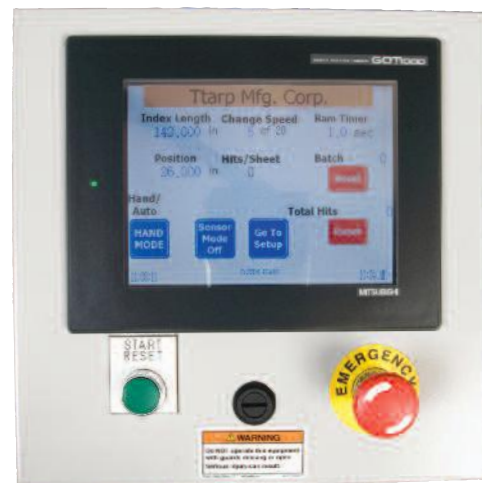
Interfaz de pantalla táctil (se monta en la consola móvil) permite una configuración sencilla, fácil ajuste durante la operación y almacenamiento de procedimientos