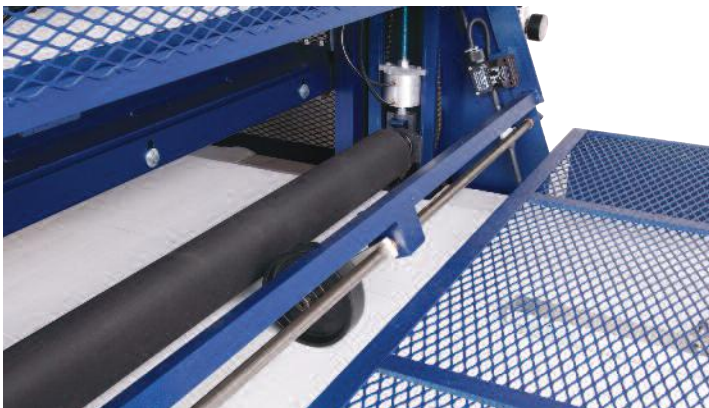
Detalle de rodillo ajustable recubierto de caucho y la rueda de sensor de hoja