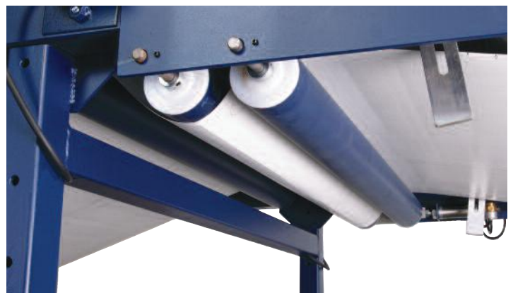
Seguimiento automático de la correa para la facilidad de uso y una vida más larga de la correa

Ttarp diseña y fabrica una gama complementaria de equipos de manufactura capaces, a precios accesibles y de fácil mantención. Póngase en contacto con nosotros para más información.